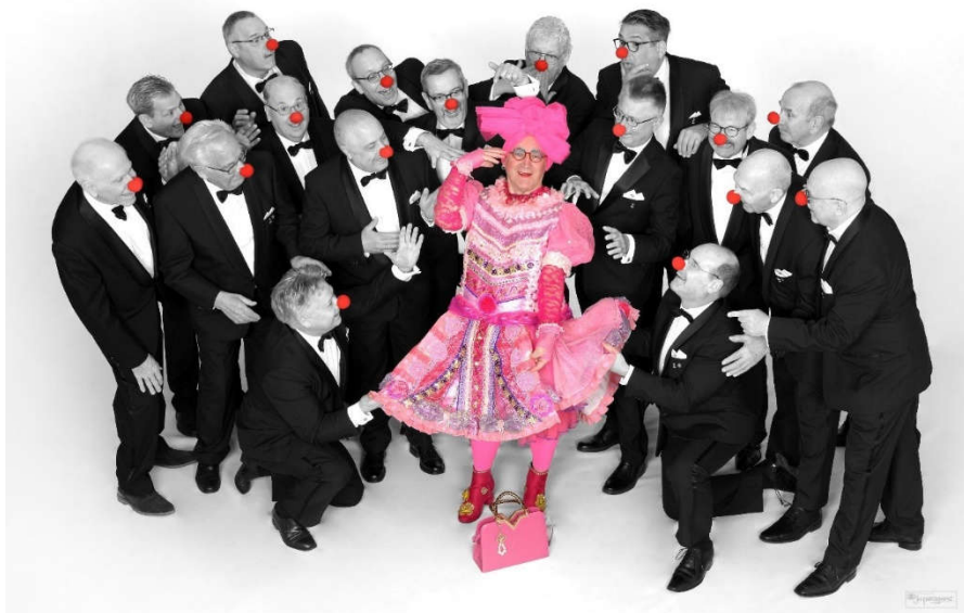
Zaterdag 24 juni 2023 in theater Kerkrade: INS JANS ANGESJ

Als je ’t met eigen ogen wilt meemaken; tickets zijn te verkrijgen bij de kassa van het PLT in Kerkrade of Heerlen of via deze link Koninklijk Kerkraads Mannenkoor St. Lambertus & Jack Vinders - Ins jans angesj - Parkstad Limburg Theaters (plt.nl)